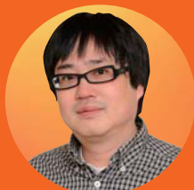
俳優 六角 精児