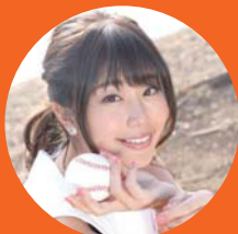
タレント 稲村 亜美